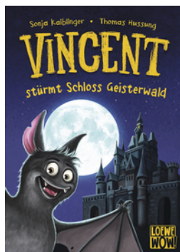
Vincent stürmt Schloss Geisterwald (Band 4)