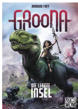
Groona - Die letzte Insel