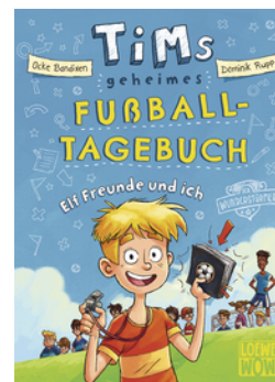
Tims geheimes Fußball-Tagebuch (Band 1) - Elf Freunde und ich!