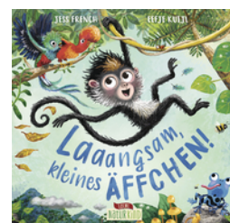
Laaangsam, kleines Äffchen!