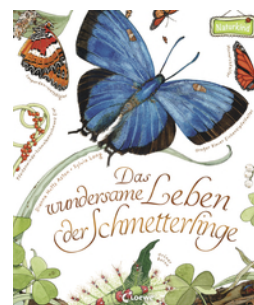
Das wundersame Leben der Schmetterlinge