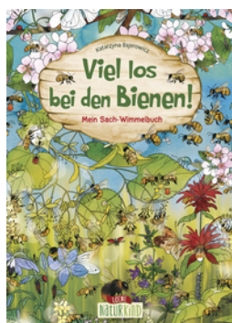
Viel los bei den Bienen!