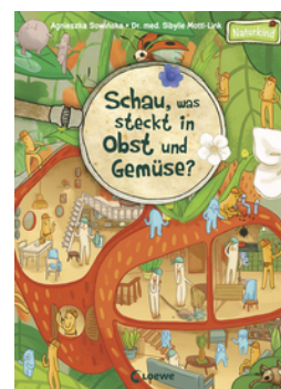
Schau, was steckt in Obst und Gemüse?