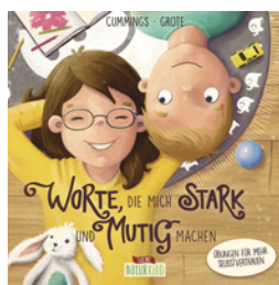
Worte, die mich stark und mutig machen