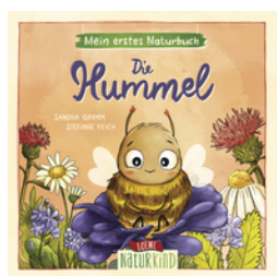
Mein erstes Naturbuch - Die Hummel