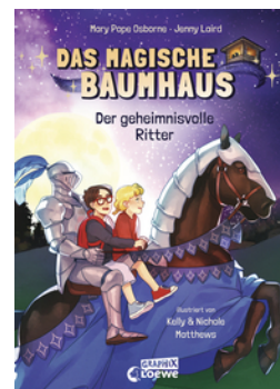
Das magische Baumhaus (Comic-Buchreihe, Band 2) - Der geheimnisvolle Ritter