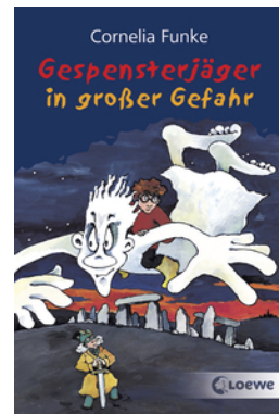
Gespensterjäger in großer Gefahr