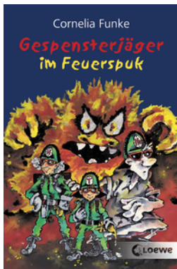
Gespensterjäger im Feuerspuk