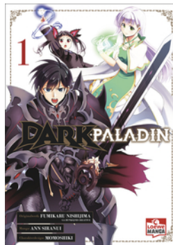
Dark Paladin 01