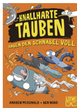
Knallharte Tauben haben den Schnabel voll (Band 4)