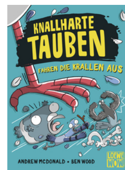
Knallharte Tauben fahren die Krallen aus (Band 7)