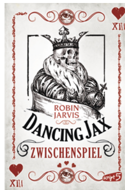
Dancing Jax – Zwischenspiel