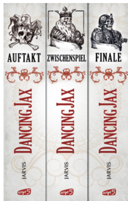
Dancing Jax - Die komplette Trilogie