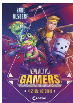
Galactic Gamers (Band 2) - Mission: Asteroid