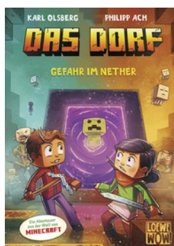
Das Dorf (Band 2) - Gefahr im Nether