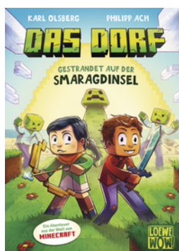
Das Dorf (Band 1) - Gestrandet auf der Smaragdinsel