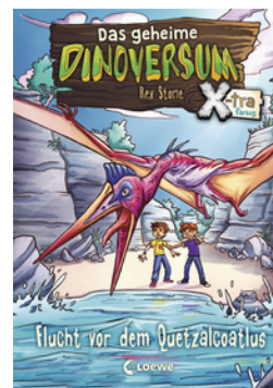
Das geheime Dinoversum Xtra (Band 4) - Flucht vor dem Quetzalcoatlus