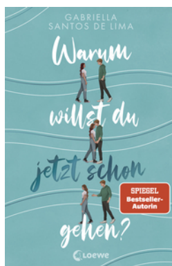
Warum willst du jetzt schon gehen?