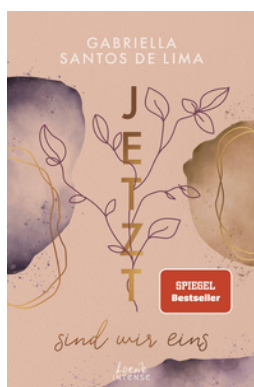
Jetzt sind wir eins (Jetzt-Trilogie, Band 2)