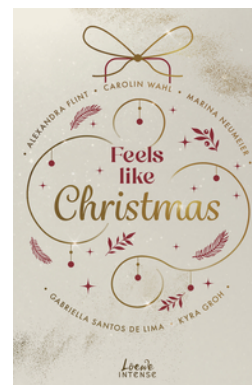
Feels like Christmas