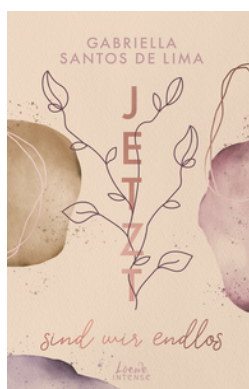
Jetzt sind wir endlos (Jetzt-Trilogie, Band 3)