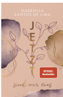
Jetzt sind wir eins (Jetzt-Trilogie, Band 2)