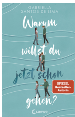
Warum willst du jetzt schon gehen?