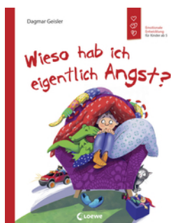
Wieso hab ich eigentlich Angst? (Starke Kinder, glückliche Eltern)