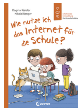
Wie nutze ich das Internet für die Schule? (Starke Kinder, glückliche Eltern)