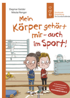
Mein Körper gehört mir - auch im Sport! (Starke Kinder, glückliche Eltern)