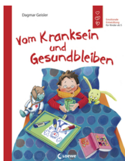
Vom Kranksein und Gesundbleiben (Starke Kinder, glückliche Eltern)