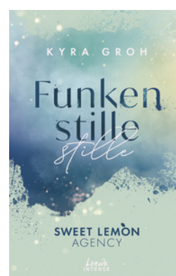
Funkenstille (Sweet Lemon Agency, Band 3)