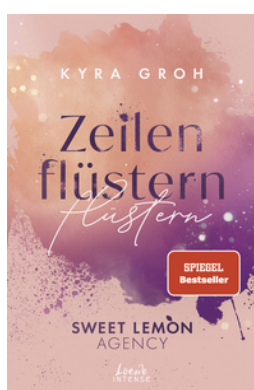
Zeilenflüstern (Sweet Lemon Agency, Band 1)