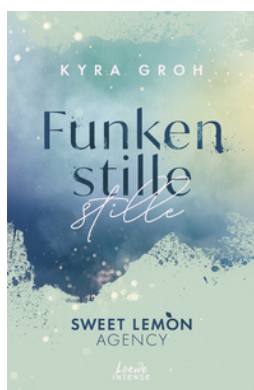
Funkenstille (Sweet Lemon Agency, Band 3)