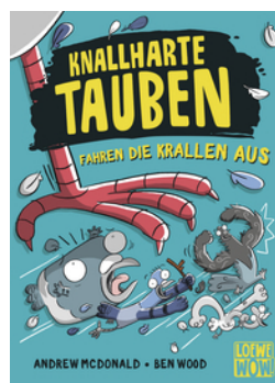
Knallharte Tauben fahren die Krallen aus (Band 7)