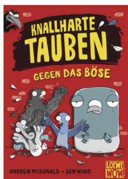
Knallharte Tauben gegen das Böse (Band 1)