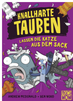
Knallharte Tauben lassen die Katze aus dem Sack (Band 5)