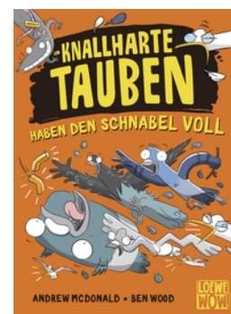
Knallharte Tauben haben den Schnabel voll (Band 4)