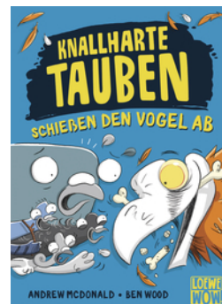
Knallharte Tauben schießen den Vogel ab (Band 3)