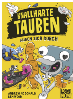
Knallharte Tauben beißen sich durch (Band 6)